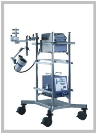
HKH 8800 (不包括气瓶和驱动器)